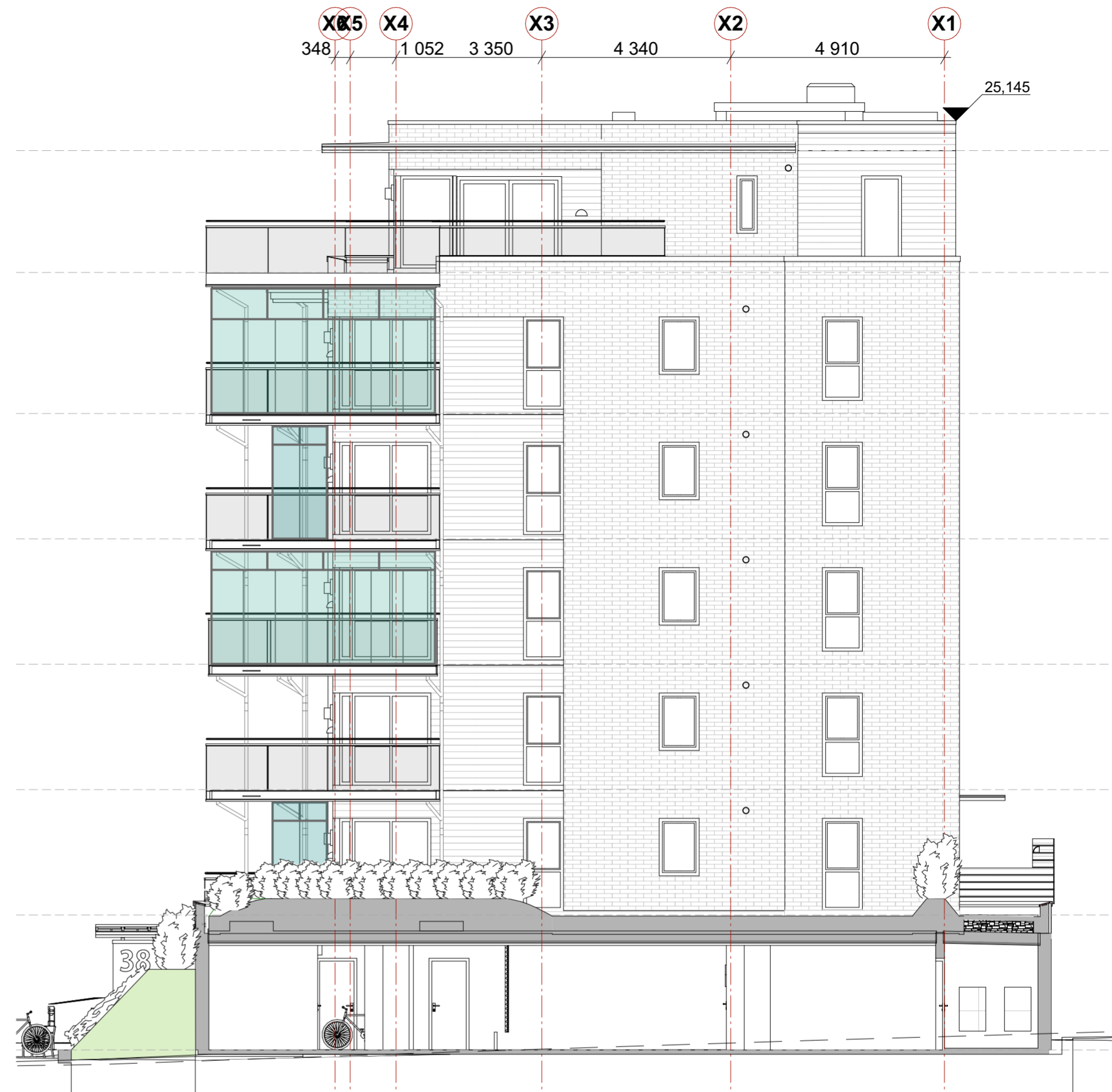
fasade mot Øst NY

PX SOLUTIONS AS INGENIØRTJENESTER, PROSJEKT- OG BYGGELEDELSE TOMTEGATA 7, 3015 DRAMMEN TLF.: +47 90 83 58 79 WEB: www.px.no