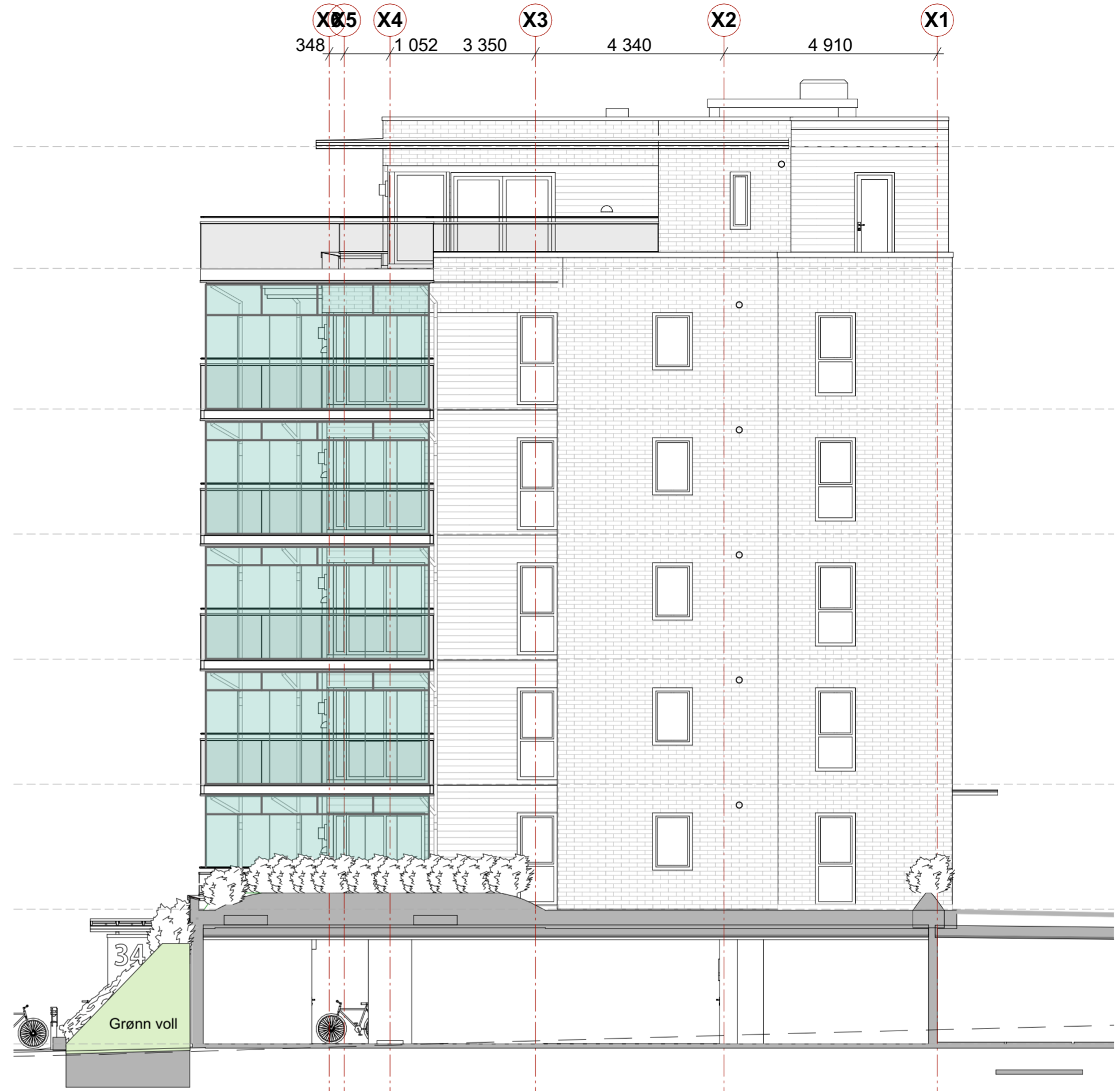
fasade mot Øst NY