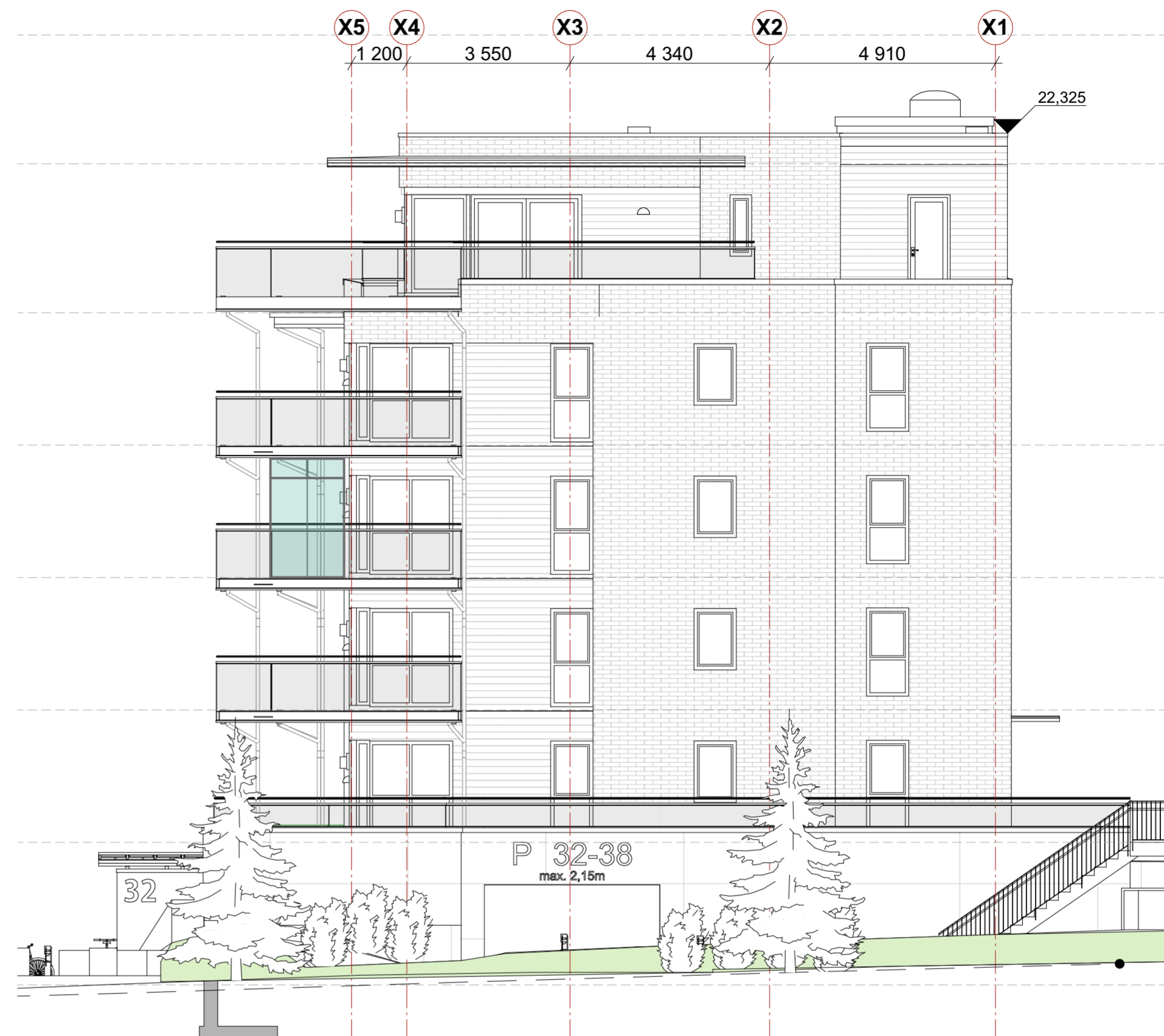
fasade mot Øst NY